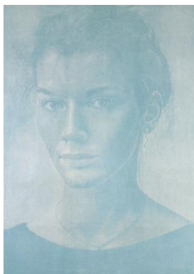
Franz Gertsch Porträts und Naturstücke