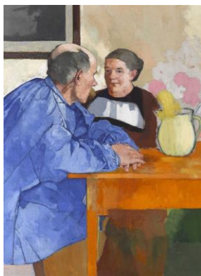
Vielfältiges Emmental Kunst aus den Gemeinden der Regionalkonferenz

Mittwoch, 2. April 2025, um 16.30 Uhr mit folgenden Themen stattfindet: